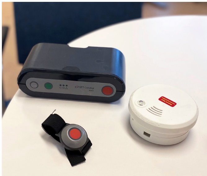
Brandvarnare kopplad till trygghetslarm.

Många kommuner har en fixartjänst som erbjuder servicetjänster i hemmet. De kan hjälpa till med att testa eller montera din brandvarnare. Ta kontakt med din kommun för att veta vad som gäller där du bor.