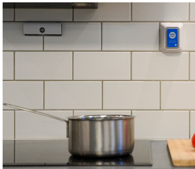
Exempel på hur en spisvakt kan se ut.

En timer bryter strömmen efter en förbestämd tid. En spisvakt är en elektronisk utrustning som bevakar spisen och bryter strömmen vid risk för brand.