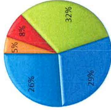
Antal doda per milj. Inv